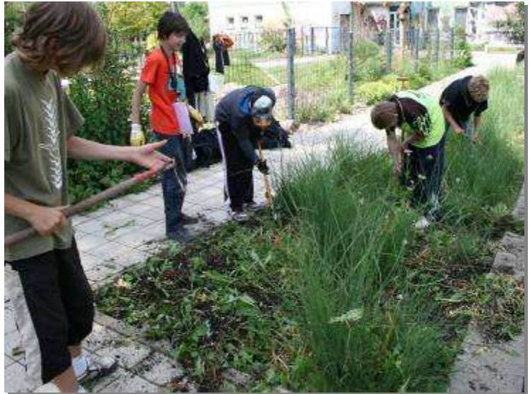
Abb.: Engagierte Schüler vor dem Klinikum, mit Bewohnern des Sophienhauses und in einer Grünanlage in Weimar-West