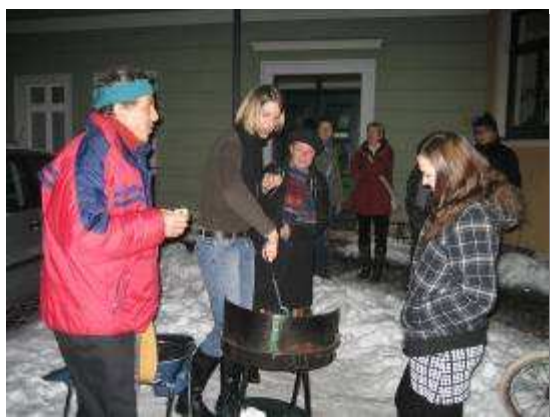
Ein Renner: Grillparty im Winter.