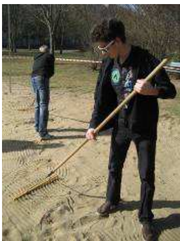
Abb.: Blumenfeen vor der Prager Str. 5; Coole Harker