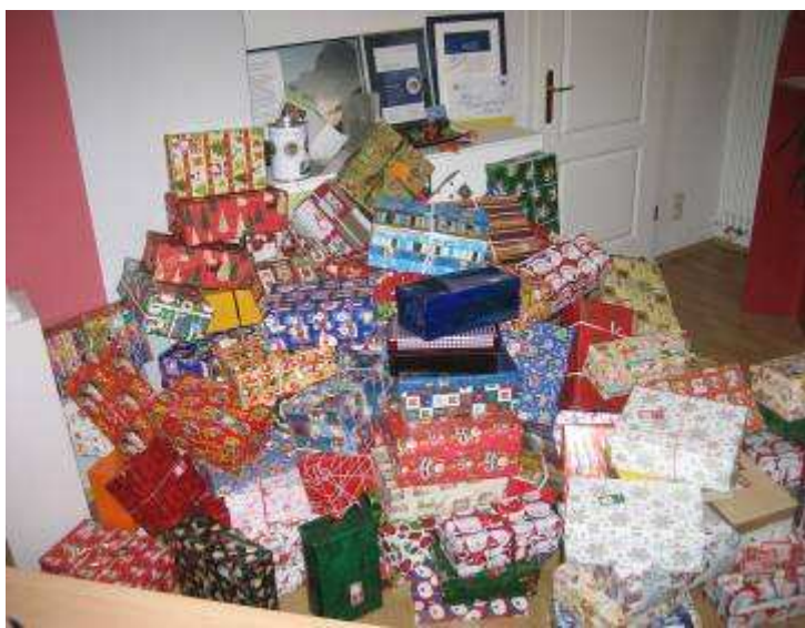
„Weihnachten im Schuhkarton“: Päckchenschwemme in der Teichgasse 12a

Am 14.12. wird unser diesjähriges Wintergrillen unter dem Motto „Advent, Advent ein Würstchen brennt“ mit Chorauftritt für Freunde, Förderer und Ehrenamtliche stattfinden.